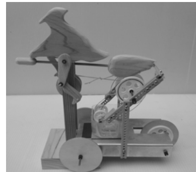
図8 形状記憶合金の形状回復力を動力源としたオートマタ

(1)は機能性材料に対する驚きと作動原理の不思議さ、(2)の受動歩行も動力を持たない模型の歩行への驚き、(3)は時を刻む機構の面白さ、(4)はからくりの面白さを備えている。また、(1)のエンジンは出力を高めるための創意工夫、(2)の受動歩行は重心の調節と歩行するための試行錯誤やデザインの創意工夫、サーボモータ駆動の2足歩行ロボットは独自のロボット開発と独自の動作プログラムの作成、(3)は振子の周期の設計や摩擦を減らす工夫、(4)は見るものを驚かせるからくりの追求が可能である。