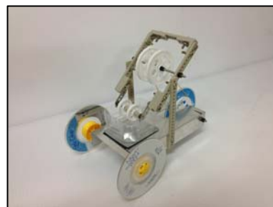
図1 形状記憶合金エンジンカー

本研究では、子どもたちが創意工夫し、学びに熱中する教材として、(1) 機能性材料を用いた教材（形状記憶合金エンジンカー）、(2) 2足歩行教材（受動歩行模型、サーボモータを用いた2足歩行ロボット）、(3) 機械式振り時計教材（おもり動力、ゼンマイ動力）、(4) オートマタ教材（風力、重力、磁力）の開発を行い、年間計画・授業案の作成とあわせて中学校「技術とものづくり」における創意工夫教材、ロボット教材として提示した。