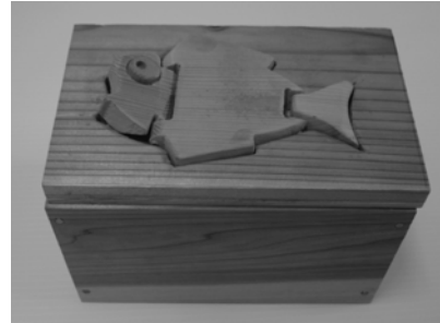
図7 磁力を動力源としたオートマタ