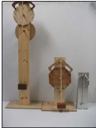
図3 木製・金属製機械式振り時計