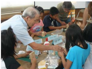
図11 世代間交流によるものづくり