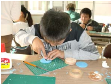
図10 ものづくりに熱中する子どもたち