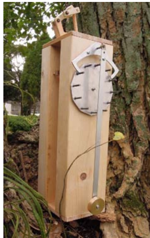
図4 オートマタ機械式振り時計