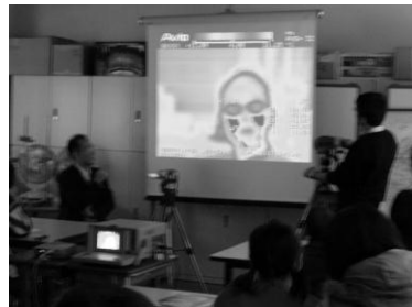
図1. 「実験・観察」型学習

「実験・体験・討論型」の教育とは、図1のような「実験・観察」による受動体験型の教育に加え、図2のような「発表・討論」による能動型の体験型教育を融合させた方法である。この方法により小さな成功体験を繰り返し経験させることができ、スパイラル・アップ方式で学生の能力を向上させることができる。そして、それらを通して、未来の技術者が持つべき科学技術への信頼と未来を切り開く強い意思や前向きな心を育てることが可能となった。