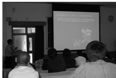
図5. 学内の科学セミナーに自主的に参加する学生たち

ミナーに自主的に参加するようになり、しかも地球環境問題やエネルギー問題に対して自分の意見をもてるようになった。これは大きな成果と言える。