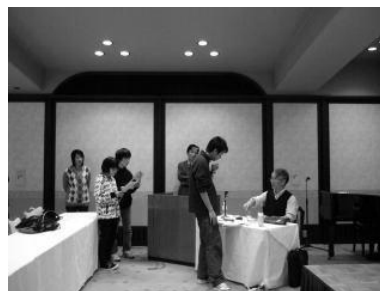
図6. 学外の科学セミナーに自主的に参加し、積極的に質問する学生達