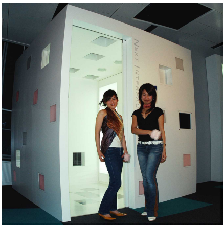
図 2. MYSQ