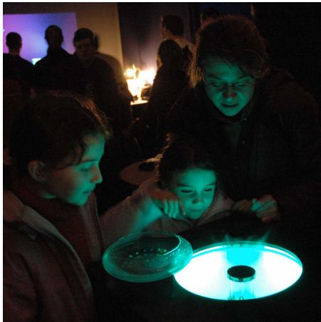
図 1. Suirin