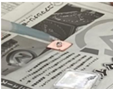
図1 銅板上への液体金属の滴下

2023年度は、舞鶴高専の専攻科1年生6名を対象として、3回目のダイオード作製実験を実施した。作製プロセスを単純化し、学生実験室で作製実験ができるように変更した。結果として、より短時間でダイオードの作製が可能となり、測定やデバイスの動作原理の説明に時間を割り当てることができた。また、アンケートにおいても、半導体デバイスの作製プロセスおよび動作原理への理解が深まったとの回答が多く、効果的な教育が実践できたものと考えられる。