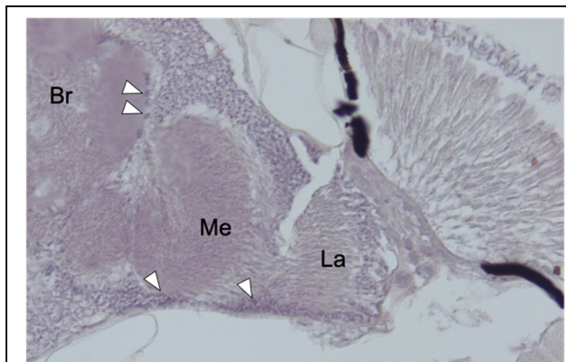
図3 ISHによる period 発現細胞の検出。脳半球と片側視葉を含むパラフィン切片。B: 脳, M: 視髄, La: 視小葉

Camponotus floridanus のセイヨウミツバチ PERIOD 抗体を用いた免疫組織染色においても脳内背側に PER 陽性細胞が観察されている [ 7 ] 他の時計遺伝子でも同様に ISH を行い確認する必要があるが、これらの細胞がクロオオアリにおける時計細胞の可能性が