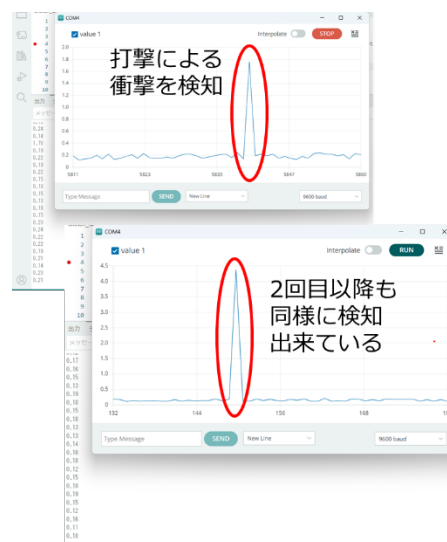
図3 Bluetoothを通じてPCにリアルタイムで表示された頭部模型での衝撃

PCやスマホ側で、脳震盪を引き起こすような過大な衝撃の閾値を設定し、閾値を上回った場合に画面に警告表示できる機能を付加することで、脳震盪やコンタクトスポーツ難聴を未然に予防する次世代型の高機能サポーターを構築できる可能性が示された。