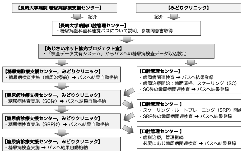
図1 糖尿病医科歯科連携診療の流れ

長崎大学病院糖尿病診療支援センター又は地域の医療機関(医療法人緑風会 みどりクリニック)にて糖尿病の管理中で、かつ過去3ヵ月以内に歯周治療を受けていない歯周病患者を対象に、連携パスの利用を開始した(図1)。院内紹介又はあじさいネットの「セキュアメール」にて長崎大学病院口腔管理センターへ紹介いただいた患者に対し、「あじさいネットを利用したネットワーク型地域連携パス説明同意書」を用いて連携パスの説明を行い、参加について文書で同意を得た後、連携パスに登録した。歯周治療開始前、スケーリング終了後およびスケーリング・ルー