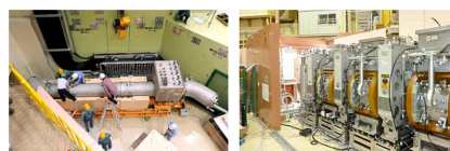
図2 本開発研究によって実現されたスーパーオメガビームライン

以上の成果をもとにした設計をもとに、スーパーオメガの建設が、平成24年度には無事終了し従来世界最高強度のパルスミュオ