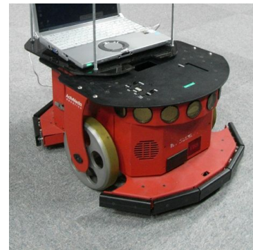
図4. 自律移動型ロボット