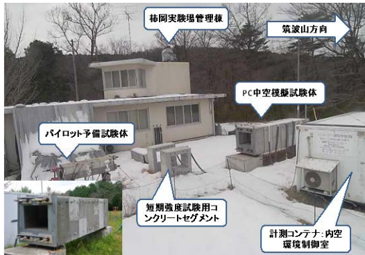
図1 柿岡教育研究施設での暴露試験

で、過剰変形と損傷の主因解明を進めている。地上構造物と異なり、地盤・地下水と接する構造表面と内空との湿度勾配みでは過剰変形を説明できないことを見出した。周辺地盤(埋戻し土)の沈下と、数値解析が可能となった項目 2)の遅れせん断破壊の両者も考慮することで、地下空間の過剰たわみの予測を可能とする見込みを得た。