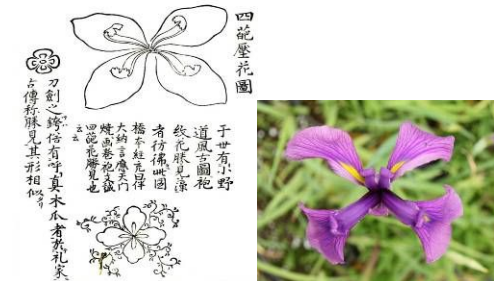
図 2 花かつみの図(左)と実際に開花したノハナショウブ(右)

採取、本学・圃場に「自生地ごとに分類して」保存することとした。日本古来から万葉集の「花かつみ」伝説に見受けられるような、優美な花を古文書を使って解析し、実際に開花したノハナショウブと照合した結果、「花かつみ」と呼ばれる幻の花は、ノハナショウブである可能性が高いことが本研究で植物学的に明らかになった(図 2)。本研究により、青森県の種差海岸における東日本大震災の復興のシンボルとしての保護活動の啓蒙と支援を行った。また、愛知県の花かつみ園では保護活動への助言を行うことができた。