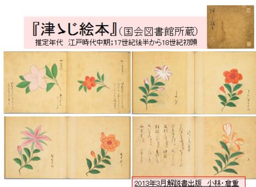
図4 解説書を出版した江戸時代のツツジ品種彩色図版「津ゝじ絵本」(国会図書館所蔵)の一部

「津ゝじ絵本」の特徴は、品種名とその簡単な解説付きで何より136品種の彩色図が掲載されていることであり、ツツジの古典園芸資料においてこのような彩色資料をはじめて一般に紹介する機会を得た。今回「津ゝじ絵本」を調査した結果、「錦繡枕」、「花壇綱目」および「花壇地錦抄」のツツジ等の園芸書と数多くの同名の品種が掲載されていることから、これまで不明であった江戸時代中期のツツジ園芸品種の花色や形態の詳細が明らかになり、現存品種との比較研究もできる点で研究資料としての学術的価値は大きいと考えられる。また、列挙された品種の解説には、「当年出申候」、「さつまより」、「琉球もの」のような貴重な品種の産地情報の解説が加えられており、ツツジの栽培が流行する中、新しい品種が次々と各地方より集まってきた品種成立過程の一端が明らかになった。