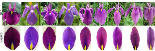
図3 ノハナショウブに見られる花容、花被の形態変異

3)。これらの花容の変異の内、栽培種に取り入れられた変異は平咲き、垂れ咲きなど8形質であり、これらはいずれも品種成立に重要な形質であることが明らかになった。栽培種には、花被数が6枚、あるいは12枚となる多弁花が認められる。野生のノハナショウブの連続変異個体によれば、内花被片が軸方向に伸長して外花被と同じ大きさになることが証明された。花被数が12枚の場合は、花柱枝、雄ずいがか花被化して色素を沈着した結果であることが明らかになった。