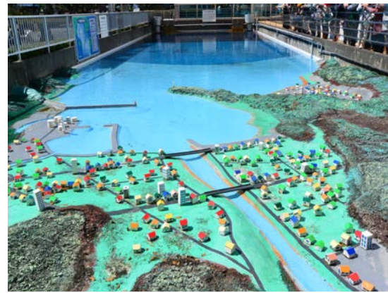
写真3 津波実験水槽（東海大学）

斜面では色が濃くなるので、地形のイメージが理解できる。現段階ではまだ学校での利用してもらうまでには至っていないが、大学生には評判が良く、段丘などの認識もしやすい。