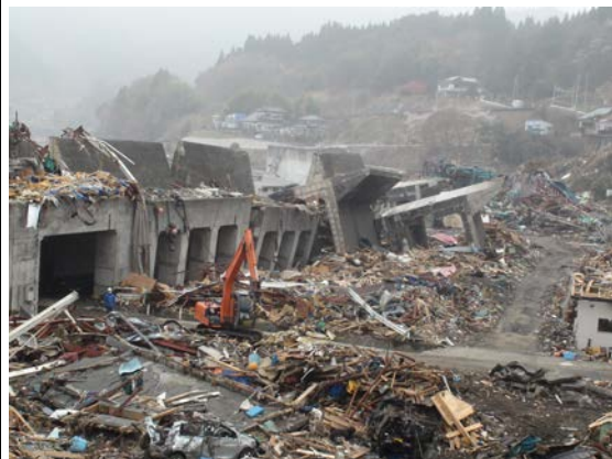
写真1 東日本大震災での被災状況(釜石市)

平成23年3月11日に東日本大震災が発生したため、平成23年度、24年度において主体的に写真、動画を収集した。また東日本大震災の現地調査を平成23年度に実施して、被災地の状況を示す映像を収集したり撮影したりした。特に岩手県沿岸部の被災地へ訪れ津波被害の状況について写真撮影などを実施した（写真1）。