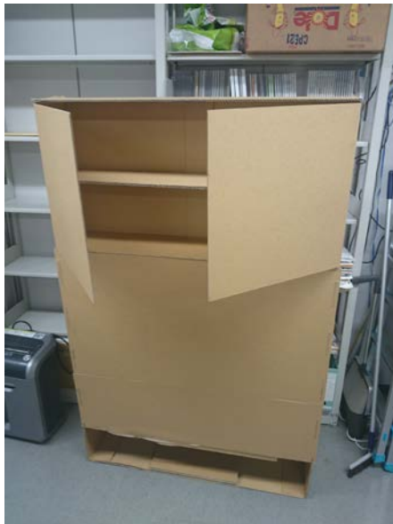
写真4 段ボール製の家具