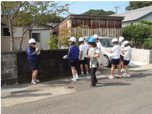
写真5 通学路のまち歩き