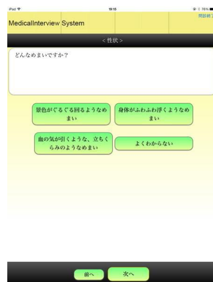
図 2 めまいの症状入力画面