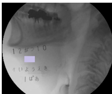
とろみ 1%嚥下時の口腔・咽頭内残留

今回の研究では、摂食嚥下障害者における口腔・咽頭機能障害に対応する最適なとろみ濃度を明らかにし、「安全」で「飲み込みやすい」とろみ濃度を決定することを目的とした。摂食嚥下障害患者の数は高齢者の増加とともに急増傾向にありそれに対応する医療従事者の数は不足している。今までは病院や施設へ入所していた患者たちは在宅へ、摂食嚥下リハを実施できていた状況は、今では嚥下支援や介助へと変化してきている。わが国の死亡原因第 3 位となった肺炎に関して、とくに高齢者肺炎と言われる「誤嚥性肺炎」への対策も「絶対に誤嚥をさせない」というものから「たとえ少量誤嚥しても肺炎にならなければ良い」というように肺炎の予知や早期対応へシフトしてきている。この現状、そして今後の対策としては、環境設定が中心となり、とりわけ食事に関する対応は大きなウエイトを占めている。摂食嚥下障害患者をとりまく医療従事者も多職種であり、介護する家族も含めて、専門的な手技をあまり必要とせず、各患者の摂食嚥下機能を把握でき、適切な食物物性を選択、提供する必要がある。今回の研究より VE や VF を使用できなくても、従来の嚥下障害スクリーニング検査に加えて、安全で簡便な舌圧測定を行うことで、患者の摂食嚥下障害の一端を把握することが出来、さらに客観的数値を用いて患者に適切なとろみ濃度を選択できることが明らかとなった。