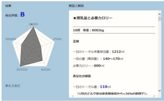
図2 フィードバック画面

また、授乳量の適切さによって、ふとり、やせ、標準に子どものイラストの体型が変化し、体重増加を数値で、さらに経過が追えるよう体重曲線をグラフ化し、自己の解答結果が可視化できるように設計した。また、最終画面上で解答結果が文字として確認でき、適切な解答例を挙げ、学習課題が明確にできるよう設計した(図3)。