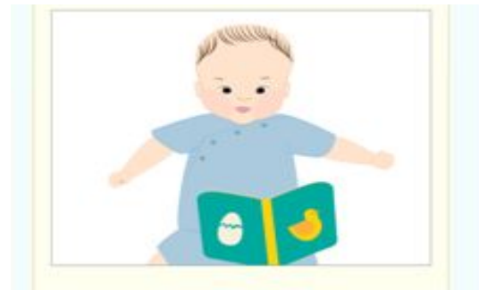
図5 不適切の解答場面