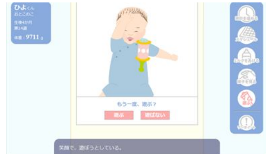
図4 適切な解答場面

から 6 か月の時期のシステムを開発した。乳児前期は、3 カ月の期間となるため、週ごとにイベントに対応するよう開発した。具体的には、平成 24 年度の新児期の教育システム検証結果を反映させ、粗大運動や微細運動、原始反射などの身体的な成長発達の特徴を踏まえ、寝返りや左右対称性などの子どもの動きに変化を持たせた。日常生活の世話では、離乳食の開始や排泄反射、予防接種や健診などの行事や発達段階に応じた遊びなどをイベントに入れた設問とし、新生児期の課題となった設問の難易性や新規性を確保した。他に、新規性や満足度が充実できるように、解答結果が可視化できるようにした。具体的には、子どもの体型や体重の変化を可視化できるよう最終画面に反映させた。他に、適切な解答の場合と不適切な解答の場合の子どもの表情や動きに変化をもたせ、子どもの反応から適切かどうか判断できるよう可視化した(図4、図5)。