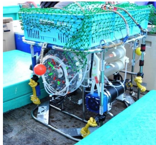
図1. ROCS現場培養機(H25年9月).

ROCSを母体とするROCS現場培養機を用いた現場培養実験を通じて、海洋中層水中の各種微生物群集、特にその細胞密度が海洋細菌の中でも大きいとその活性等、未だ明らかでない海洋性古細菌群集の増殖速度や物質代謝速度の測定を試みるため、3年間の研究期間で、低温、高圧下で使用可能な新型培養機の改良、漁船を利用した現場培養実験手法の確立、ならびに採水機ROCSの制御プログラムのさらなる改良と現場培養実験を行った。