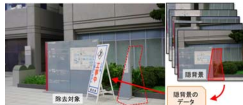
図2 隠背景映像重畳による実物体の消去