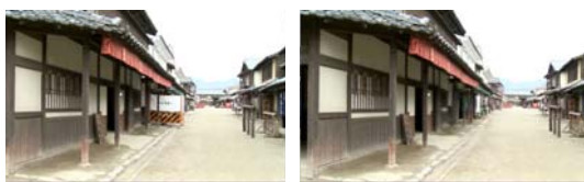
図4 屋外での DR 処理 (工事中の看板を除去)

平面近似が可能な隠背景を対象に、除去対象領域周辺の領域を周辺参照領域として定義し、隠背景再構成結果の位置ずれ、画質ずれを軽減するモデルを確立した。続いて、平面近似が難しい隠背景に対して、幾何形状を一切利用しない Light Field Rendering (LFR) を DR に応用することで解決し、その利点及び欠点を洗い出した。隠背景平面拘束を緩和するという観点から、簡易な背景の幾何形状と画像を利用して、カメラ位置姿勢推定と画質ずれの軽減を実時間で同時達成する機構を開発した。