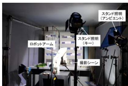
図5 DR 実験用スタジオ

DR 技術全体の体系化を目指し、系統的データ取得が可能な DR 実験用スタジオを構築した。この実験スタジオでは、実物大セット、1/12 ミニチュアセットが設置されていて、ロボットアームに付けたカメラの移動制御が可能であり、様々なデータを収録することができる (図5)。