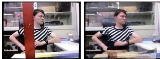
図6 動的な背景に対する DR 処理結果 (右)

上で動作させることで、インタラクティブに隠背景を指定して再構成する領域を指定可能にした。また、任意形状に変化する隠背景に対しても DR 処理を実現した (図6)。