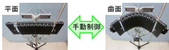
図3 凹面型超音波スピーカの試作

【極小領域オーディオスポット】複数台の超音波スピーカを用い、空間のある1点にだけ音を届けるオーディオスポットを実現した。