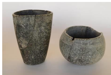
副葬されていた石製容器

埋葬の中には副葬品をとまなう例が少なからず認められ、特にクロライト製の石製容器、石製ビーズなど、高度な工芸技術によって製作された遺物も確認された。貝製ビーズは地中海産の貝を素材としたものもあり、500 km近い距離を交易などによって入手していたと考えられる。多数出土している黒曜石とともに、長距離交易の発達を示す資料である。