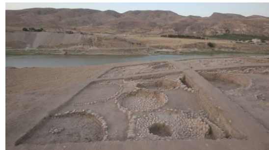
新石器時代の遺構検出状況

(1) ハッサンケイフ・ホユック遺跡において実施した発掘調査により、新石器時代初頭の定住集落の実態を明らかにする多くの資料を得ることができた。この遺跡が初期の定住的集落であることは、先土器新石器時代の人為的な堆積が10m近くにも及び高いテルを形成していること、石の壁をともなう恒久性の高い遺構が数多く確認されていること、貯蔵用施設と考えられる小型の遺構が多数検出されていること、住居の床下を中心に計100基以上の埋葬が検出されていること、持ち運びに向かない石皿などの重量のある遺物が多数出土していることなどからある程度判断することができる。