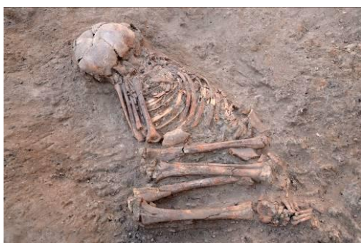
彩色の施された埋葬人骨

遺構の床下から検出された114体の埋葬の中には、人骨に赤色と黒色の顔料によって彩色の施されているものが確認された。理化学的な分析により、赤色の顔料は酸化鉄であること、黒色のものは炭素を主体としたものであることが確認された。中には二次葬と考えられる事例も認められるものの、解剖学的位置を保ったまま検出された一次葬と認定できる事例も多く認められ、遺体を一定期間置いて軟部組織がなくなるのを待って、人骨に直接顔料を彩色した可能性が高いことが考えられるようになった。単に遺体を埋葬するだけでなく、このように複雑な葬送儀礼が執り行なわれていたことが明らかになった。形質人類学的な分析の結果、彩色の施された人骨の性別や年齢に大きな偏りは認められず、特定の集団にこうした行為をおこなったものではなく、一般的な葬送儀礼の一環であったと考えられる。