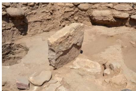
石灰岩製板石検出状況

ほかの遺跡でも知られており、こうした特別な建物は基本的に集落到1基ほど存在するのが通例であることから、公共建造物的な性格を持つと指摘されている。集落を統括するための儀礼などがおこなわれた特別な建物であったと考えることができる。