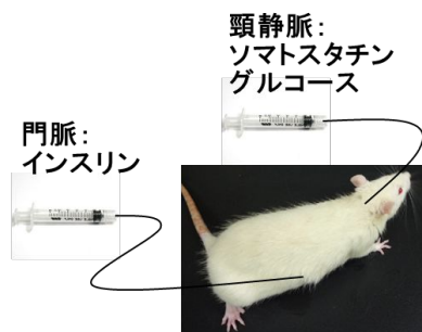
図1: 実験のイメージ図

研究方法の の、生体内におけるインスリン波形への情報の多重化を明らかにするには、生体の肝臓に任意のインスリン波形を与える必要がある。通常用いられている生体を用いたインスリンの刺激方法は頸静脈からの注入である。しかしこの方法は、非常に技術を必要とするものであり、さらに、我々の注目している臓器である肝臓に到達するまでにインスリンの波形が「鈍って」しまう（生体内の実際の波形と異なってしまふ）ため実際の入力波形は不明のままである。そこで、ラットの門脈に直接チューブを挿入し、シリンジポンプを用いてインスリン刺激を行う手法を開発に取り組んだ(図1)。