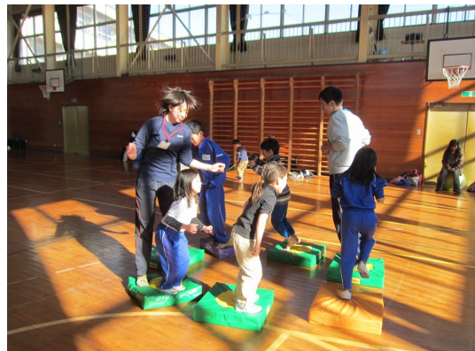
写真1 ピョンピョンランド

(2) 精華小学校では、北茨城市の教育委員会の呼びかけで集まった近隣の小学校の親子を対象に、各種の遊具を用いた運動を指導した。「JPクッションによる「ピョンピョンランド(写真1)」スクーターボードによる「スーパーマンランド」など、子どもたちにイメージを持たせた遊戯的な運動空間を設定した。つまり、指導するというよりは、遊具の特性に合わせて、親子で自由に遊べる雰囲気大切に。その結果、子どもたちを対象に調査した二次元気分尺度における活性度は顕著に上昇する傾向が示された。