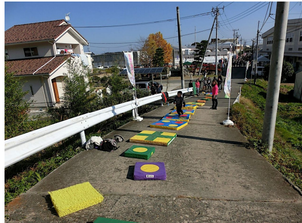
写真4 高台避難路におけるクッション遊び

今後、被災地では引き続き避難訓練が実施されるが、こうした「動き豊かな学校」の発想に基づけば、高台へと登る活動への意欲も喚起され、その継続性の向上が期待される。