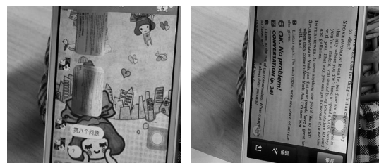
写真1(左) 写真2(右): どちらも留学生の携帯端末画面

留学生の SNS 記録の分析から約 8 割の留学生が授業の課題、試験準備を行う際、友人とオンライン上で協働学習を行ったことがあると答えている。留学生の友人との通信時の録画記録から、彼らの相互学習の事例を見ることができる(写真 1、2)。