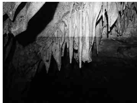
図 1 気仙沼神明崎管弦窟内の鍾乳石表面に残る 3. 11 津波の浸水跡(標高約 4 m)

(1) 調査した全 15 洞穴の内、内陸の洞穴(紫波町)、陸前高田市の洞穴および神明崎の 2 洞穴(洞口標高が 8 m 以上)を除く洞穴には、3. 11 津波が流入した痕跡(瓦礫や貝殻・海藻の堆積・付着など)が認められた。特に、神明崎先端部に開口する管弦窟では、標高約 6.3 m までの壁面に流入した海水によって運ばれたと考えられる海藻片等が付着しており、また、標高約 4.0 m には明瞭な浸水ライン(図 1)が認められた。これらの標高は、神明崎付近での津波痕跡高と調和的な値であった。