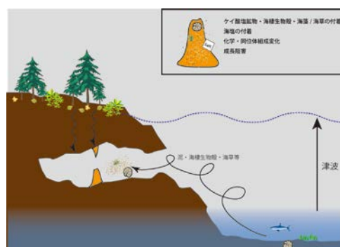
図4 津波などにより一時的に海水に没した鍾乳洞・鍾乳石に記録されうる痕跡

(7) 神明崎洞穴群の浸水状況や採取した鍾乳石の状態（特に表面への付着物）などの観察結果も参考にして、津波履歴の記録媒体としての鍾乳洞や鍾乳石の可能性を考察した。上述のように、津波が流入した洞穴の鍾乳石の表面には泥および枯葉や海藻片などが付着する場合があります。それらの物質がその後通常の鍾乳石の成長に伴って付加していく炭酸カルシウムで固定される可能性がある。また、津波流入時の鍾乳石成長表面において海塩由来の成分（例えば硫酸塩）の濃度が他の部分よりも高くなる（直接的に海水に接したことが原因である場合と、洞内に滴下水を供給する石灰岩体やその上位の土壌層に残存した海塩由来成分が降水に溶存して滴下水として供給される場合が考えられる）ことや、塩害による植生変化（ただし、神明崎では津波前後で顕著な植生変化の証拠は見いだせなかった）に起因するたとえば鍾乳石の炭素同位体組成の変化すること、なども鍾乳石に残されうる津波痕跡の候補と考えられる（図4）。しかし、低い標高に位置する洞穴内の鍾乳石は、高潮などによっても海水の影響を受ける可能性があり、津波の影響との識別に注意を要すると考えられ、今後の課題でもある。