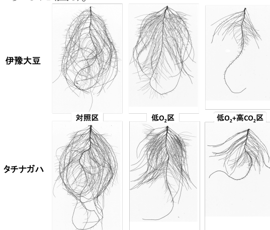
図3 処理終了時の根系

地上部乾物重は、両品種とも低O 2 +高CO 2 区の方が高い値を示し、処理間差は認められなかった。地下部乾物重は、両品種とも低O 2 +高CO 2 区の方が低い値を示し、伊豫大豆およびタチナガハでそれぞれ40.4および27.5%減少した(図3)。