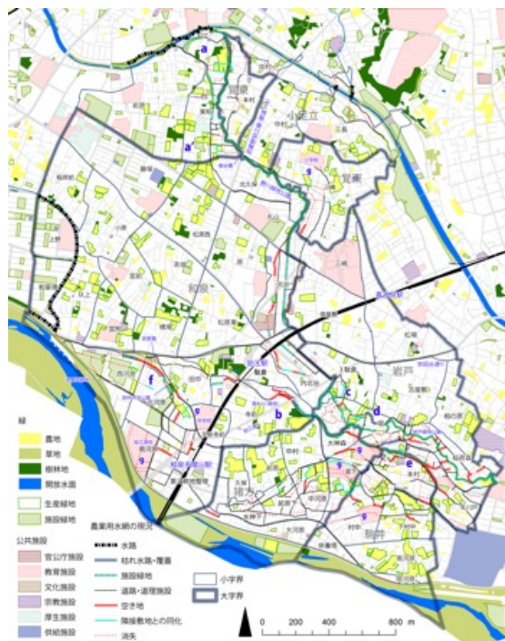
図1 対象地における主な河川と水路、字界、地形