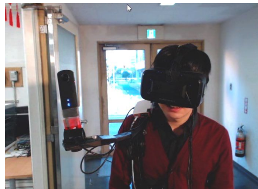
図 2: デバイスを装着した外出者

複数ユーザ対応にも自然に拡張できると思われるが、今後実装していく予定である。最終年度に実装したシステムの構成は図1の通りである。今回はアバタを表示するために外出側でもビデオ透過型HMDをOculusRiftおよびOvrvision PROを利用して実装した。外出側(移動者側)の映像はTHETA SをRaspberryPi2に接続して室内側(観察者側)に送る。外出側では室内側ユーザの動きが送られてくるのでそれが反映したアバタを外出側ユーザのビデオ透過型HMDに表示する。図2は、外出者がデバイスを装着した様子の写真である。一方、室内側ユーザの動きは頭部の動きをやはりOculusRiftのセンサーで取得し、手の動きはジェスチャ入力デバイスであるLeapMotionで取得する。これによ