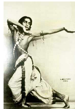
ウダイ・シャンカール

地道な方法だが、大英図書館や仏国立図書館、国会図書館(日本)や大学図書館など国内外の図書館や資料館で、19世紀末から20世紀前半の舞踊や演劇に関する記事や批評を収集し分析・考察する。また、実際の舞踊家や研究者とも密接に連絡を取り、研究会を開催する等の方法で、意見や情報を交換する。