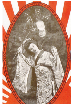
日本舞踊を踊るアンナ・パヴロワ