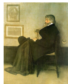
カーライルの肖像

研究期間の後半には、イサドラ・ダンカン（1877-1927）の影響にも注目した。古代ギリシアへの回帰を呼びかけ、「モダンダンスの母」となったダンカンの踊りも、「プリミティヴ」であるがゆえに、多くの芸術家に衝撃を与えた。だが実際には彼女の踊りは全くの素人のそれではなく、一定の技術を要するものであった。またダンカンの踊りは、クラシックバレエのようにアクロバティックな技術を要するものではなかったが、そのシンプルな踊りは、余白に美を見出す東洋の芸術の影響が感じられる。現代芸術の大きな特徴の一つはミニマリズムだが、ダンカンの踊りがモダニズムへの道を開いたのは、間接的かもしれないが東洋の芸術の影響があったからだと考えられ、ここに舞踊におけるジャポニズムの昇華した形が見られる。