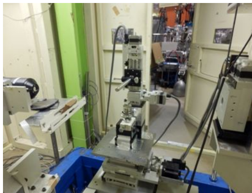
図 1 KEKPF に取り付けられた応力負荷装置

高エネルギー加速器研究機構フォトンファクトリー (KEKPF) でデジタル放射光トポグラフにより、応力下での欠陥、主に転位の動的観察を行う際に必要な 応力負荷装置 の開発を行った。図 1 はその装置の写真である。垂直方向に数 mm/sec の速度で針が移動し、試料に微小硬さの測定と同じように、局所的に応力を加えることが出来る。この装置を KEKPF の実験ラインに装着して、正方晶リゾチウム結晶に針で応力中のデジタル放射光トポグラフの撮影に成功した。しかしながら、リゾチウム結晶では画像の解像度、針と結晶の位置関係、初転位密度に依存する個々の転位像の分解能などが十分でないことが分かった。この中で一番の問題点は使用したリゾチウム結晶は初転位密度(成長転位)が高く、応力下によって導入された運動転位との区別が十分でないことが判明した。