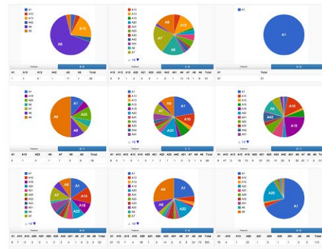
図 2 : 可視化インタフェース

図 2 は我々の実現したシステムにおいて、月地震の波形を分類し可視化した一例である。SOM によって地震波の多次元データを二次元のグリッドにマップした。そして各グリッドにおいて、Nakamura によってラベル付けされた、震源域の割合を円グラフで表示している。すなわち、もし 1 つの