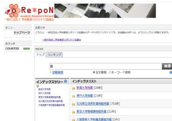
図1 学術資源群 (科学実験機器) によるサブジェクトリポジトリ (トップページ)