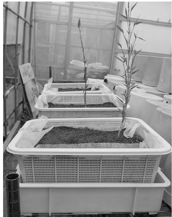
図2 モウソウチク地下茎からの分泌液の採取方法(2)