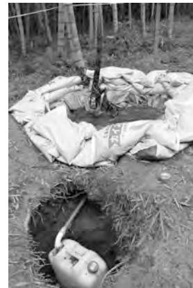
図1 モウソウチク地下茎からの分泌液の採取方法(1)