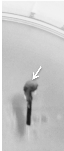
図3 モウソウチクの若節から得たカルス (矢印部分)