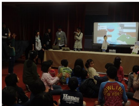
図5. 実際の上映の様子(水戸聾学校)

開発したインタフェースを用いて人形劇のシナリオのデザインを行い、子どもたちに実際に劇に参加してもらうための準備及び、劇の内容に没頭できたかどうかについて、検証した。人形舞台との調整後、予備実験を行った。日常経験的動作によるインタラクション機能を実装した人形劇の評価を行った。聴覚障害児11名(3~6年生)を参加者とした。質問紙法を用いた評価の結果、児童の楽しく没入的な鑑賞体験を保證したことがわかった。システムを改良後、最終的には、特別支援学校および小学校で上演しその評価をもとにインタフェースの改良やコンテンツのデザインの評価を行った(図5)。さらに協働的インタラクションゲームを実装した聴覚障害児対応人形劇を開発した。聴覚障害児18名(3~6年生)を参加者とした評価実験を行い、質問紙法を用いて調査した。その結果、システムUIの有効性が確認された。これらの実証実験の評価を踏まえて、国内外の学会において発表論文等で公表するとともに、本研究の最終のまとめを行った。