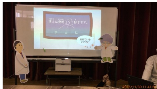
図3. 人形と追隨する台詞表示の例

そこで、表示させる台詞を人形の動きに追隨して表示できるかを検討した。また台詞の表示の大きさやフォントの形状をコンテンツのシナリオに合わせて変化させ、観客の没入感が増すように表示を開発した(図3)。聴覚障害者に対応した人形劇における音声情報手段として、吹き出し型字幕が発話者である人形の位置に合わせて自動的に提示位置を決定する技術の一部を開発することができた。聴覚障害者大人の10名を対象とした予備的な評価では、同技術による情報保障に好意的な評価が得られたが、この技術の有効性に関しては、まだ障害者の子供に実験できる完成度には至っていない。この台詞追隨は今後の課題となっている。