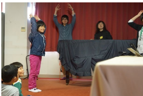
図4. インタラクションの様子

開発したインタフェースを用いて人形劇のシナリオのデザインを行い、子どもたちに実際に劇に参加してもらうための準備及び、劇の内容に没頭できたかどうかについて、検証した。人形舞台との調整後、予備実験を行った。日常経験的動作によるインタラクション機能を実装した人形劇の評価を行った。聴覚障害児11名(3~6年生)を参加者とした。質問紙法を用いた評価の結果、児童の楽しく没入的な鑑賞体験を保證したことがわかった。システムを改良後、最終的には、特別支援学校および小学校で上演しその評価をもとにインタフェースの改良やコンテンツのデザインの評価を行った(図5)。さらに協働的インタラクションゲームを実装した聴覚障害児対応人形劇を開発した。聴覚障害児18名(3~6年生)を参加者とした評価実験を行い、質問紙法を用いて調査した。その結果、システムUIの有効性が確認された。これらの実証実験の評価を踏まえて、国内外の学会において発表論文等で公表するとともに、本研究の最終のまとめを行った。