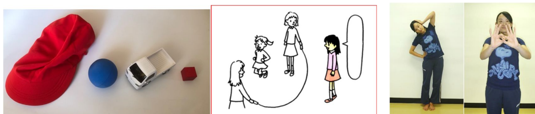
図1. 検査課題に用いる用具 左から 指示の理解 あいさつ 動作模倣

開発した尺度は玩具や絵カードなど(図1)を用いた、子どもとのやりとりを通した個別検査とした。まず、いくつかの課題を考案・設定し予備調査を行った。対象は1歳から8歳の保育園・幼稚園・小学校低学年児、計577人であり、検査実施後、項目別に年齢別通過率および50%通過年齢を求め、何歳相当の項目かを検討した。また、実施しにくいものや同じような発達曲線の項目は省き、尺度を作成した。作成した尺度を用いて健常幼児に対して、標準化作業および性差の検討、他検査との相関の検討などを行った。