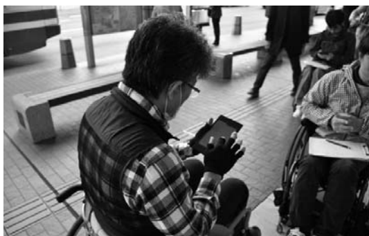
図3 車いす利用者による通り評価

げられた。また、通りの選択については、横断勾配が大きいと片手走行になり体の負担が大きくなるため、勾配の小さい通りを優先的に選ぶといった意見や、日常よく使用する通りを選ぶといった意見が挙げられた。車いすナビゲーション・システムの評価では、ビジュアルについては 3D によるまちなみの再現が分かりやすいといった一定の評価を得ることができたが、高低差の表現や施設名などの情報の追加の要望があった。各経路の探索結果の検証では、最短経路は、車いすでは段差等のバリアによって通行が難しく、より安全な経路の方を選択するといった意見が挙げられた。筋力最少経路では、上り坂を避けることが評価された。車いす使用者が評価した経路は、現実的であり、車いす使用者の高い満足を得ることができた。しかし、利用者の身体的状況、介護者の有無等の条件設定が必要になるといった意見も挙げられた。