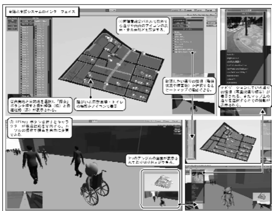
図1 身障者支援システムのプロトタイプ

(1) -5. 車いす使用者が最短・最適経路を走行し検証した結果、最適経路は最短経路に比べて実際に身体負担の少ないと感じる経路であったと評価を得た。一方で支援システムでは考慮されていない車とぶつかる危険のある通り、下り坂で人とぶつかる危険のある通りが選択される問題点、そして経路によっては曲がる回数が多くかえって身体負担が大きくなる可能性が明らかとなった。