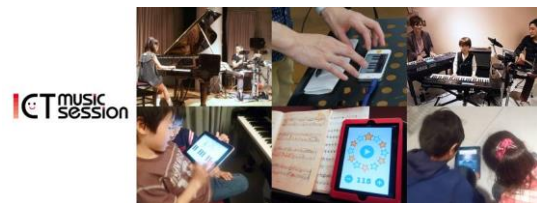
写真1 ICT Music Session Vol.1～音楽レッスンにおける電子テクノロジーの可能性～