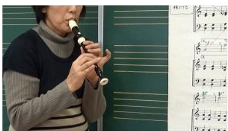
写真3 音楽専科教員によるリコーダー模範演奏

②エルガー「威風堂々」～「ファ#の吹き方」に関する演奏ポイントの説明と実演(38秒)、「サミング」の演奏ポイントの説明と実演(25秒)、「前半通奏」実演(35秒)、「後半通奏」実演(56秒)、「全体通奏(ピアノ伴奏付)」実演(72秒)、「ピアノ伴奏」実演(71秒)(2015年3月)