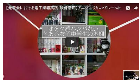
写真5 アニソンボカロメロデー プレゼンテーション

Preziで制作したアニメやボカロに関するプレゼンテーション、iMovieを使って編集した日常生活の映像をバックに、児童がそれぞれドラム演奏を行った。これらは、演奏によって自分を表現するための一方法として提案したが、特に前者は、論理的思考力や創造性、問題解決能力の育成に深く関係するものである。