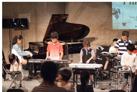
写真4 ICT Kids Band(GHOSTBUSTERS)

未就学児童がiPadでギターと効果音を担当する合奏(ICT Kids Band(GHOSTBUSTERS))を行った。特にギターについては、iPadを使用することによって技能の制約を解消した。電子技術を媒介にすることによって、異年齢の児童同士のコラボレーションが可能になることを示した。