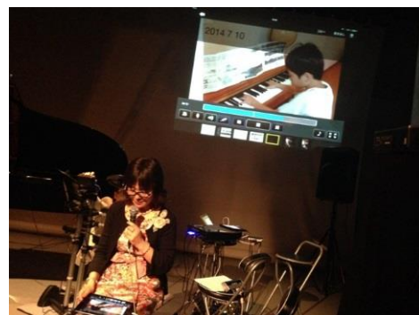
写真2 ロイロノートの活用したピアノ学習の記録