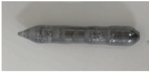
(写真) 平成26年度にFZ法で作成したLaNiC 2 の単結晶。

続いて平成27年度は、空間反転対称性の破れた超伝導体LaNiC 2 に関して、中性子小角散乱法によるヘリカル磁束相の存在実証にかかる磁束格子の超格子反射の観測挑戦と中性子非弾性散乱実験による物質内の揺らぎと超伝導の発現機構解明に関する研究を予定していたが、上記の通り、平成26年度に実施予定であったLaNiC 2 の磁束格子の存在を確認するための中性子小角散乱実験が延期されていたため、平成27年度は、良質な単結晶試料の育成条件探索の継続と磁束格子観測のための中性子小角散乱実験を実行するよう研究計画を立て直した。