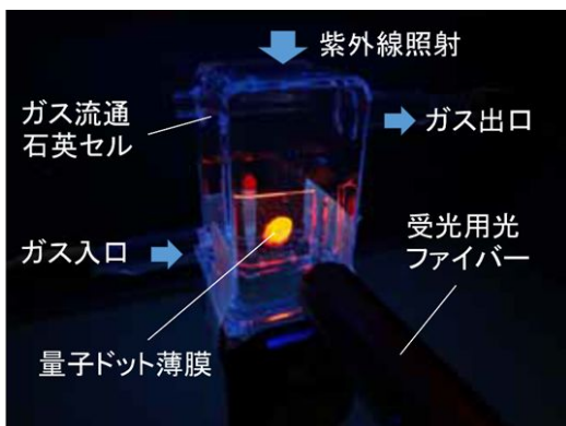
図1 ガス流通光学セル中に格納された量子ドット(QD)薄膜が紫外線(波長 365 nm)照射下で蛍光を発する様子

で半導体産業における有機物除去や洗浄、中濃度域(200 ppm 程度)で病院や医薬品製造施設での殺菌・脱臭、低濃度域(0.01~数 ppm)でクリーンルーム等建物内空間や水の殺菌・脱臭、食品・畜産業等に利用が広がっている。また成層圏のオゾン層は太陽からの紫外線を吸収し、地上の生物を守っている。しかし、 O_3 は有用な反面、大気中約 1 ppm 以上で目や呼吸器、神経等の中毒症状を引き起こし、50 ppm を超えると生命の危険が生じ、1000 ppm 以上では短時間で死亡する。光化学オキシダントの主成分ともなる。近年、一般向けに脱臭用小型 O_3 発生装置が市販されているが、狭い室内空間で使用すると、作業環境許容濃度 0.1 ppm を超過し得るという問題がある。 O_3 は高電圧や電気火花発生を伴うコピー機や電気モーターからも発生する。そのため O_3 センサの必要性が増している。本研究では、電気式と異なり電気火花発生の危険がないので安全性が高く、遠隔非接触操作ができる光学式ガスセンサの中でも、光吸収利用型よりも高感度が期待できる蛍光利用型光学式 O_3 ガスセンシング技術を研究開発する。そのため、0.1~500 ppm の範囲で濃度制御した O_3 を含む合成空気を、光ナノ複合材料を格納したガス流通光学セルに流すシステム、ならびに、 O_3 濃度を変化させた時に、光ナノ複合材料の蛍光強度とスペクトルの変化を高速測定できるシステムを構築した(図1)。