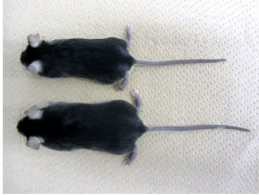
図 1. 野生型マウス (下) と GH-cre; Dgcr8 fl/fl マウス (上)

GH 産生細胞特異的 miRNA 欠損マウスの作成 Dgcr8 遺伝子を欠損するコンディショナルノックアウト (CKO) マウス (GH-cre; Dgcr8 fl/fl ) を作出したところ、(GH-cre; Dgcr8 fl/fl ) マウスは、野生型マウス (Dgcr8 fl/fl マウス) に比べ低体重を示し (図 1)、下垂体の矮小化を呈した (図 2)。さらに、血中 IGF-1 濃度の低下を認めた。これらの結果は、GH 産生細胞において miRNA が細胞分化と成長ホルモンの産生を制御していることを示唆する。