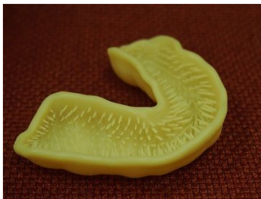
図 2 : 3D プリンタ (CAD/CAM) により出力されたオーダーメイド歯ブラシ