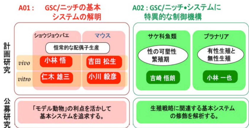
図 2 : 本研究領域の掲げた目的に挑戦するためのラインアップ

計画研究を核とし、さらに公募研究の参加を得て、GSC/ニッチの基本システムの理解のために厚みのある研究を展開することを目指した。平成 21-22 年度に 6 件、23-24 年度には 8 件の公募研究が本項目に参画した。ショウジョウバエ (佐野、丹羽) とマウス (金井、篠原、永松、安部、磯谷、相賀、嶋、恒川、) の他、ハムスター (金井、恒川)、ニワトリ (斉藤)、メダカ (中村)、ゼブラフィッシュ (新屋) といったモデル生物を用いて、分子生物学、分子遺伝学、細胞生物学、組織形態学、細胞生物学といった手法を用いて、上記目的に挑戦した。