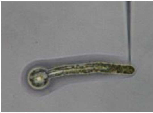
図1 伸長細胞へのマイクロインジェクション ゼニゴケ胞子を弱青色光下で4日間培養すると、細胞分裂せずに伸長する。光源は図の右側に位置する。細胞は光源側に伸長し、葉緑体も光源側に集合している。穿刺は光源側の先端部に行った。細胞の長さは約300 μm。

胞子を発芽、分裂させて得られた細胞はプロトプラスト化しやすく、かつ1細胞からの再生能も高い。そこでプロトプラストに対して穿刺を試みたが、プロトプラストの細胞膜は穿刺に脆弱であることが判明した。プロトプラスト化後、細胞壁の部分的な回復を待って穿刺を試みたものの、キャピラリーは貫通するが細胞は破壊されない程度の強度をもった細胞を調製するに至っていない。葉状体の切断面から再生する細胞の利用も検討したが、穿刺した細胞の追跡が容易ではないので不採用とした。