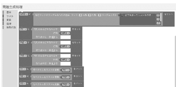
Fig. 1 実装仕様書の作成画面（問題生成処理）

エクスポートに際して、数学問題用のブロックは、ツールによってブロックから Maxima を基本とした STACK 形式のプログラムコードへと変換され、XML に追記されている。例として