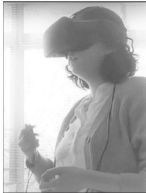
◀ 図 2：HMD を装着して VR 学習システムを使用中のユーザー（右）と、稼働中のシステム（左）。