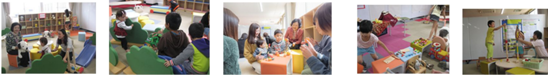
写真 6: 大学発ネウボラの継続母子支援センターの実施風景

2019 年 4 月より「大学発ネウボラの継続母子支援センター」は開設され、筆者らは、積極的に参画した(写真 6)。地域の母子や大学生たちが多く参加(延べ 210 人)したが、参加者への研究調査は実施しなかったが、これらも、本研究の社会的波及効果の一部と考える。