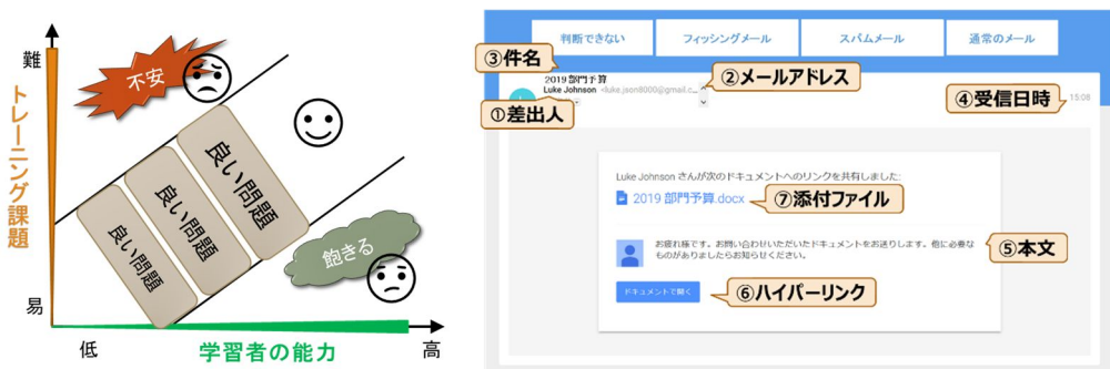
図 3. フィッシングメール判別トレーニング環境

セキュリティリテラシの中でも特にフィッシングメールに対する判別スキルをトレーニングするための課題出題手法を提案した。具体的には、トレーニング課題の難易度を実際に収集したフィッシングメールやスパムメールの事例から設定する手法を定式化し、前年度に開発したオーバーレイモデルと組み合わせることによって、学習者の判断能力のレベルに応じた課題出題を実現する手法を提案した。実際の事例に基づいて難易度を設定することができるため、新たなセキュリティインシデントの動向に対応した課題を容易に取り入れることが可能となった。