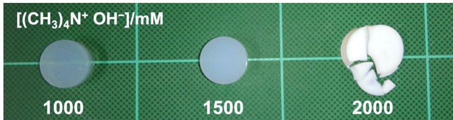
図1 1,4-ビス(メチルジメトキシシリル)ブタンを前駆体とする1段階塩基反応により得られたエアロゲルの外観。図中の数字は用いた塩基触媒の濃度。

第二の方法として、ビニルシランおよびアリルシランのラジカル重合を用いた検討を行なった。一例としてビニルメチルジメトキシシラン (VMDMS) をまずラジカル重合し、得られたビニルポリマーを加水分解・重縮合することでポリビニルポリ(メチルシロキサン) (PV-PMS) エアロゲルを作製した例について述べる。ジ-tert-ブチルペルオキシド (DTBP) を重合開始剤として用いたやや高温での VMDMS のバルク重合を行なったところ、5 mol%・120 °C・48 時間の条件において重量平均分子量が約 9,000 (重合度が約 68) のポリマーが得られた。これに対しさらにベンジルアルコール中、強塩基触媒を用いた 1 段階塩基反応を行うことで、光透過性を示す多孔質のエアロゲルが得られることが分かった。VMDMS から得られた典型的なエアロゲルは 0.16–0.22 g cm -3 の範囲のバルク密度を示し、メソ孔領域の細孔構造からなることが分かった。一軸圧縮試験における弾性率は同程度の密度の PMSQ エアロゲルよりも高く、80 % 圧縮後に完全に変形回復した。圧縮-再膨張サイクルにおけるヒステリシスも小さく、迅速に変形回復するゲルであるといえる。また、100 回以上の繰り返し変形にも耐え、強度と柔軟性の非常に高いエアロゲルが得られることが明らかとなり、常圧乾燥も容易であることが分かった。