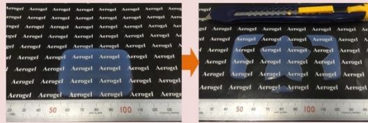
図 2 VMDMS から得られたエアロゲルの特異な性質。