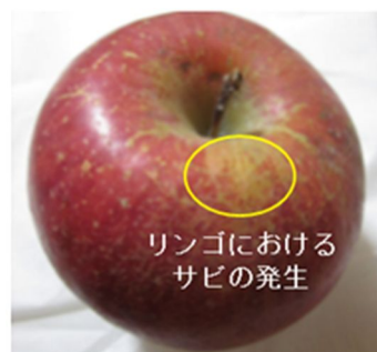
第1図 リンゴにおける果面のサビ形成は果実の品質を損なう劣悪形質

果面全体を覆ったコルクがその特徴であるニホンナシは例外であるが、それ以外の多くの仁果類果樹において、果面のサビ発生は一般的に劣悪形質とされている。代表的な仁果類であるリンゴにおいても、光沢や色彩を有する果面の外観品質を損なうことから劣悪形質とされており、その制御が課題となっている(第1図)。リンゴのサビ形成は果面のクチクラに生ずる微小亀裂が外観上の起因とされ、それが拡大すると周皮層のスベリン化が促進されてサビが発達すると考えられている。その誘因としては、降雨、薬剤、強い日射、ウイルス感染などが報告されている。リンゴにおいては、果樹の中では比較的充実しているゲノム情報を利用して、これまでにクチクラやサビ形成に関わるいくつかの候補遺伝子が報告されているが、サビ形成の原因遺伝子は特定されていない。