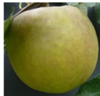
第2図 リンゴ‘ふじ’の枝変わり品種‘ゴールドファーム’

本研究では、この状況を打破する有効な材料としてリンゴ‘ふじ’の枝変わりにより果皮にサビが形成され錆褐色となった‘ゴールドファーム’に着目した(第2図)。この独自の突然変異品種を原品種である‘ふじ’と形態学的手法によって詳細に比較することで、まず果面のサビ形成過程を明らかにする。さらに、サビ形成過程の果皮においてトランスクリプトーム解析を遂行することで、リンゴのサビ形成を制御する原因遺伝子の解明を目的とする。本研究は、仁果類で最もゲノム研究とその公開が進んでいるリンゴを材料としていることから、豊富なゲノム情報を遺伝子解析に活用できることが強みである。