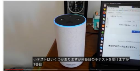
図 1 音声 UI による Moodle 上の小テスト受験の例 (Alexa スキル)