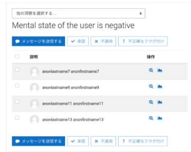
図3 アナリティクス用の独自のターゲットによる洞察の例

学習者の心的状態など、外部データをモデルの指標として選択することができるようにするために、外部データを Moodle に取り込むプラグイン（活動モジュール）を作成し、その外部データを指標として利用可能にするクラスと独自のターゲットを追加するためのクラスを定義した [9]。