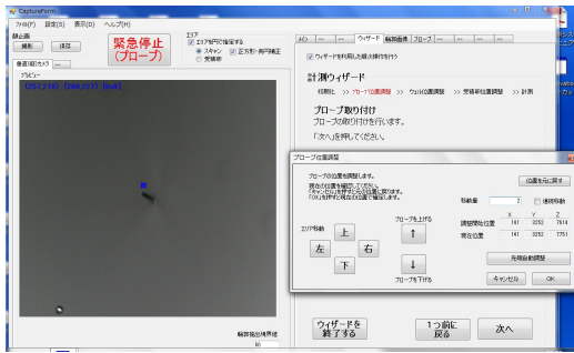
図2. 新たに開発した自動呼吸解析ソフト。図の右側には CCD カメラからの画像が表示される。一方、図の左側には数値入力のためのボタンが多数設けられている。