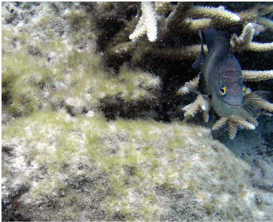
図1. クロソラスズメダイと、そのなわばりに繁茂するイトグサ

植物と植食者との相互作用系を紐解いていくことは、私たちがこの地球上の生物多様性や、生態系の仕組みを理解する上で不可欠である。植物は生産者として有機物を生み出し、それを食べる植食者とともに地球の生物多様性の大半を占める。陸上生態系においては、植物と植食者との間に高い種特異性が見出され、両者の共進化や頻繁に起こった寄主転換が、生物多様性の多くを生み出したと考えられている。一方、水域生態系では、一次生産の多くを担う植物は微小な藻類であり、それらは一般に形態が単純で観察や採集が困難なため、多くの隠蔽種の存在が予測されている。そのため水域の藻類と藻食者との関係において両者の種特異性は著しく過小評価されてきた。申請者はこれまでの研究で、形態だけでは分類が困難な微細な藻類を、DNA塩基配列を用いて分類し、サンゴ礁に生息する藻食性スズメダイ類と、そのなわばり内のイトグサ類との間に高い種特異性があることを発見した。なかでもクロソラスズメダイは、なわばり防衛に加えて除藻も行うことでイトグサの一種をなわばり内に繁茂させ主食として利用しており、一方そのイトグサもクロソラスズメダイのなわばりのみを生息場所としていた(図1)。こうして両者は互いの生存を依存しあう絶対栽培共生にあることが明らかとなった。