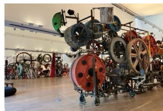
動く資料の展示の様子

動く作品を展示している Museum Tinguely（スイス・バーゼル）は、キネティック・アート（動く美術作品）の代表的な作家であるジャン・ティンゲリーの作品を収蔵しているが、彼はその多くの作品で工業材料の廃材を利用して電気加工を加え動く作品を作っている。それらは、作られた当時のまま動く作品として展示され続けている。もちろんさまざまな素材は経年劣化して脆弱になる。同館には、作品のメンテナンスのために電気系技術者であるコンサバター達が専属で配置されており、既製品で手に入らない部品は彼らによって手作りされる。いっぽう資料保存のために、観覧者にも「待つ」という協力が求められる。資料を消耗させないように展示資料を動かす回数には制限が設けられており、動いている姿を見るためには待たないといけない。派手なパフォーマンスをする資料は大人気で、大きな音を立てて展示作品が動き出すと、子供達だけでなく大人も嬉しそうに集まってくる。