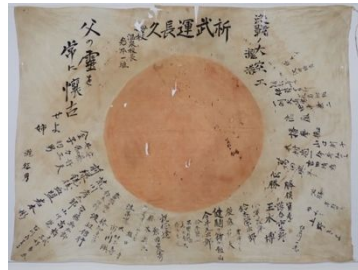
染料の褪色と生地がみられる日章旗

近現代資料を保管している資料保存機関での状態調査を重ねるうちに、とくに戦時期の布資料の劣化損傷が予想以上に進行していることに気づいた。布は吸湿性が高く、全体的に染みやフォクシング(茶色の小さな斑点状の染み)が生じやすい素材であるが、他にも顕著に見られた劣化症状が、たとえば、日章旗やデモ行進寄せ書きや垂れ幕などの亀裂や破損などである。これらの資料は当事者が身につけたり持ち歩いたりして使われたことに意味をもつ資料でもある。そこで、本研究調査においては、ピックアップする素材の一つに戦時期布資料を選定した。調査項目は必要最小限の項目を設定し、限られた時間の中で採取できるデータを将来的な保存計画に有効に活用することを目指した。この調査項目を設定するにあたり重視した点は、調査対象機関の布資料が第二次世界大戦期に集中しているという特性を、資料素材や劣化症状のうえでも顕在化させることが第一の主眼である。この時期以降には、合成素材により製造された大量生産的な市場流通素材が一般的にも使われるようになる。しかし、そのような新しい素材については未だ劣化に関する研究が進展しておらず、今後の劣化傾向や劣化速度が予測しきれないという懸念がある。しかし、より早く資料