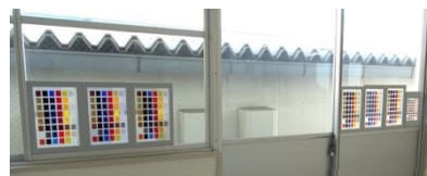
暴露試験中のプラスチックと合成樹脂塗料

支持体の樹脂と塗料の組み合わせも経年劣化の進行に影響している。例えば、PVC（塩化ビニル）にアクリル塗料やエナメル塗料を塗るとベタついて使えなくなる。これはPVCの中の可塑剤が塗料と反応してしまうためである。本研究では日常的に使われることの多い種類の合成樹脂のシートに、アクリル樹脂絵の具、アクリル系合成樹脂塗料、エナメル系合成樹脂塗料、水溶性合成樹脂塗料、水性アクリル樹脂塗料、アルコール系マーカー、油性マジックの各色で彩色したシートを作成し、自然光の当たる廊下の窓に貼付して暴露試験を行った（暴露期間2021年7月～2023年7月）。プラスチックシートの黄変色は、ポリスチレンに顕著にみられた。塗料の変褪色は、油性マジックは黒色以外は全てのシートでほぼ剥落した。アルコール系マーカーも黒色以外は全て色抜けしている。塗料の剥離が多くみられたのは、PEポリエチレンシートである。また、エナメル系合成樹脂塗料も彩色端部の層状剥離が多くみられた。調査用のプラスチック各種のサンプルキットを作製したが、実際のプラスチック資料には塗料が使われており、外見からは構成素材が目視判別できないものが多い。その点では制作過程の発注記録や製品仕様書などの保管も同時に必要である。