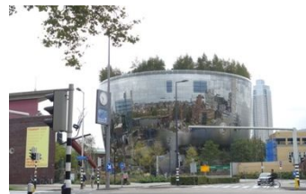
Depot Boijmans Van Beuningen

あえて大まかな言い方をすると、現代資料は使われているほうが傷みにくい、あるいは、目の届くところで触っているほうが、傷みにも早期に気がつきやすい、と言えるだろう。ただし、それを可能にするには、現状維持する理論と技術の構築が必要である。ミュージアムの中でも Depot Boijmans Van Beuningen（オランダ・ロッテルダム）の取り組みは先駆的である。この施設は倉庫である。と言っても、各種資料ごとに保管に適した温湿度が設定された収蔵室内での環境管理をはじめとして、全館的な IPM（Integrated Pest Management：総合的有害生物管理）にも力を入れている。長年に渡る本館の大規模な改修工事の間、隣接する敷地に7階建ての収蔵施設を建築し、そこで15万点にも及ぶ全ての資料を収蔵展示しながら可視化する（廊下側の大きなガラス窓から自由に見学できる）という、世界でも初めての新しい取り組みに成功している。見学は予約制であるが盛況で、収蔵庫にも入れる見学ツアーや資料保存のレクチャーなどにもこまめに対応している。